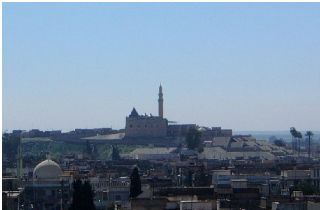
Meczet Jonasza na wzgórzu Nebi Yunus w Mosulu

24 lipca 2014 tzw. Państwo Islamskie wysadziło ( http://www.thesun.co.uk/news/2728270/nabi-yunus-shrine-mosul-isis ) w powietrze świątynię Nebi Yunus — trzeba podkreślić, że było to miejsce święte zarówno dla chrześcijan, jak i muzułmanów, wierzono bowiem, że był to grobowiec proroka Jonasza (po arabsku Yunus). Świątynia była znana jako Meczet Jonasza. Po wysadzeniu świątyni ludzie ISIS zaczęli drążyć tunel głęboko pod ruinami. W ten sposób odkryto nietknięte fragmenty pałacu Sennacheryba ( http://www.telegraph.co.uk/news/2017/02/27/previous-untouched-600bc-palace-discovered-shrine-demolished ).