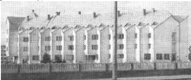
„Przybudówka” do powyższego kościoła stanowiąca dopełnienie idei miłosierdzia, plebania-pensjonat dla kilku kawalerów. FiM