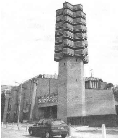
Kościół na łódzkim Teofilowie — sakralne cudo architektoniczne, FIM