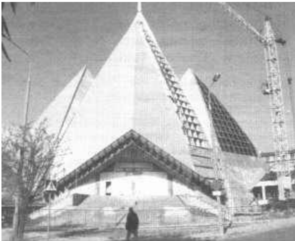
Kościół pod wezwaniem Matki Boskiej Królowej Świata w Radomiu — architektura w stylu otwartej pomarańczy wielkości wieżowca z krzyżem na czubku. FiM