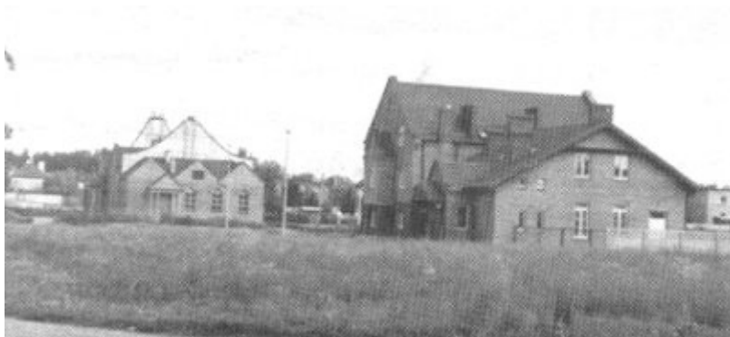
Parafia Ducha Świętego w Ostrowie. Kościół znajduje się po stronie lewej, po prawej — wiadomo. FiM