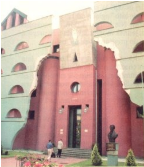
Kościół Braci Zmartwychwstańców w Krakowie