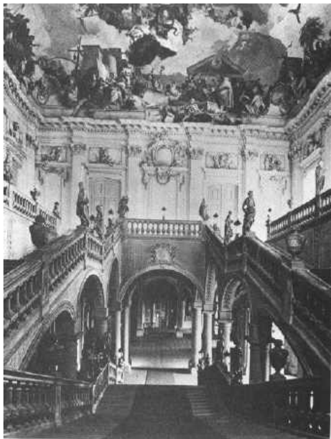
Barokowe wnętrze pałacu biskupa z Würzburga, Podręcznik do historii 2 kl.