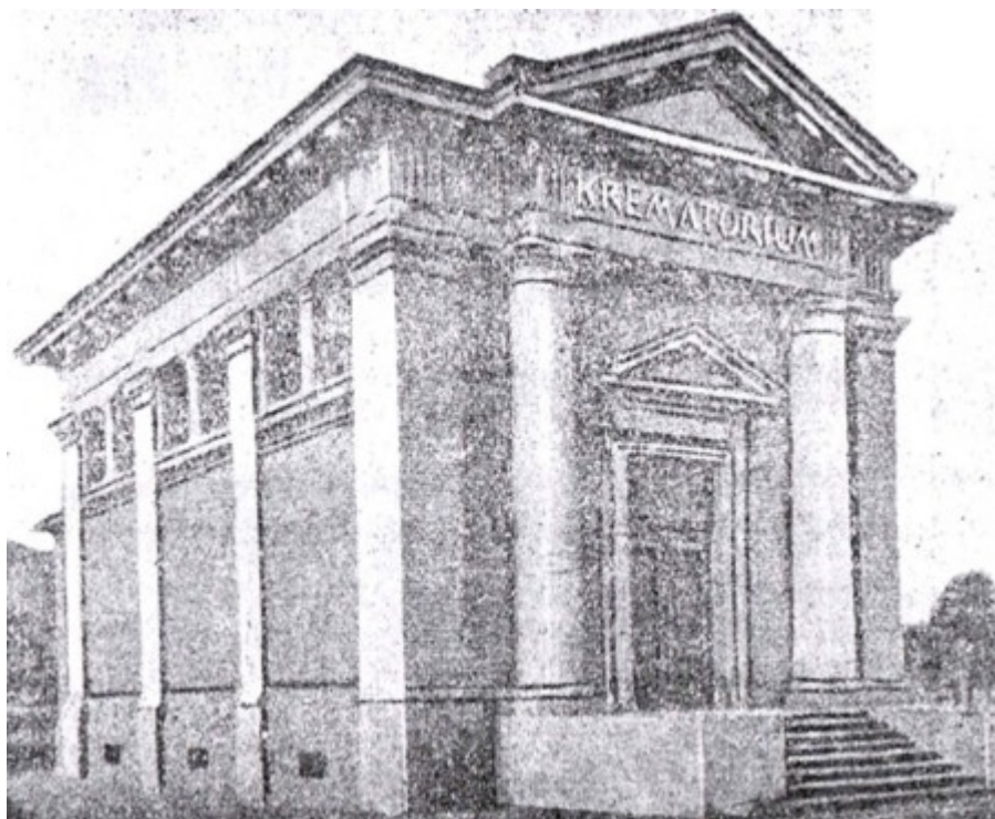
Krematorium w Zurychu

W samych Niemczech w r. 1900 w 24 krematoriach spalono 6.084 zwłok, w r. 1918 w 53 krem. — 15.873 zwł., w r.1927 w 77 krem. 40.066 zwł., zaś w r. 1928, tylko w drugim kwartale w 82 krem. spalono już 12.085 zwł., (w tym: mężczyzn 6568, kobiet 5517), co świadczy o stałym zwiększaniu się liczby zwolenników kremacji w Niemczech.