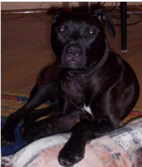
Pita, ośmiomiesięczna pit bull-ka

Nieścistość w nazewnictwie ujawnia się również w owej liście psów agresywnych ( http://pl.wikipedia.org/wiki/Wykaz_ras_psov_agresywnych ). De facto nie ma na niej amstaffa! A oto ona: Amerykański Pit Bull Terrier, Dog argentyński ( http://pl.wikipedia.org/wiki/Dog_argentyński ), Rottweiler