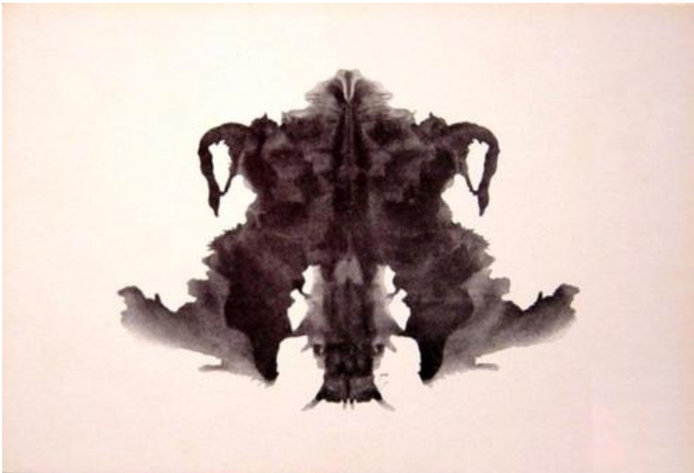
Beck: ukryte zwierzę, skóra, dywan Piotrowski: zwierzęca skóra, skórzany dywan (41%) Dana (France): zwierzęca skóra (46%)