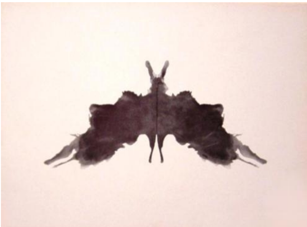
Beck: nietoperz, motyl, ćma Piotrowski: motyl (48%), nietoperz (40%) Dana (France): motyl (48%), nietoperz (46%)