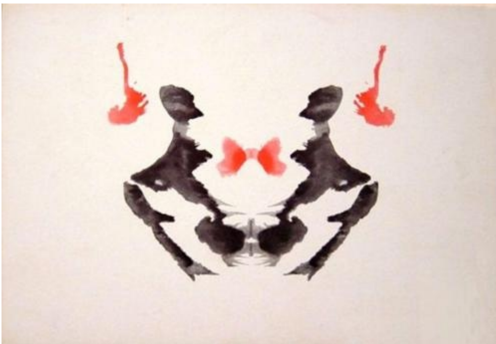
Beck: dwoje ludzi (szary) Piotrowski: postaci ludzkie (72%, ciemna plama) Dana (France): człowiek (76%, szary)