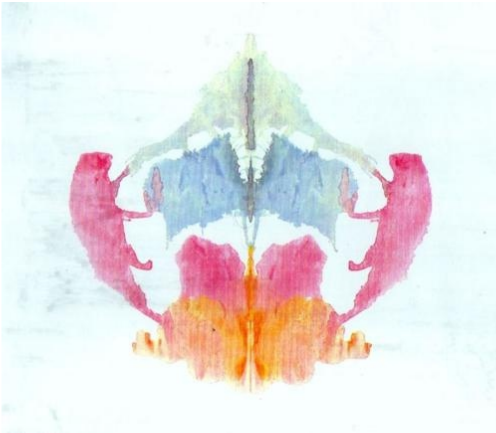
Beck: zwierzę: nie kot lub pies (różowy) Piotrowski: czteronożne zwierzę (94%, różowy) Dana (France): czteronożne zwierzę (93%, różowy)