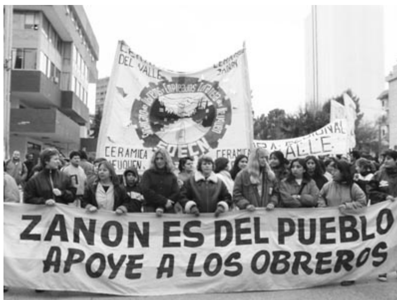
"Zanon należy do ludzi"